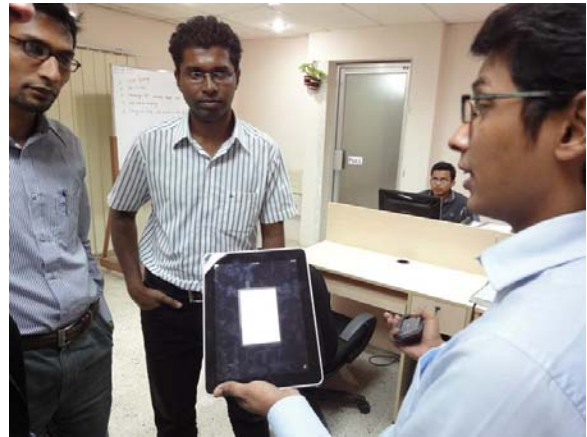
Dhaka: ontwikkelaars van iPad applicaties