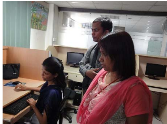
Dhaka: dienstverlening op grafisch gebied