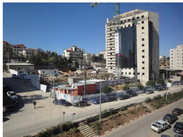
Ramallah: bouw nieuw (IT)-kantoorgebouw